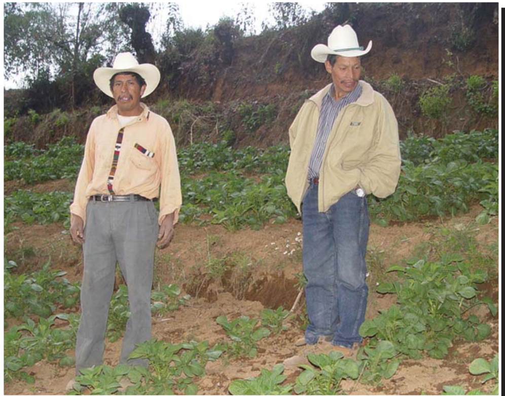
Los agricultores de la aldea Subchal, cuya cosecha logró las normas de calidad internacional, muestran con orgullo sus lotes.