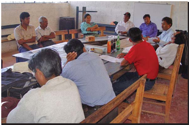
A pesar de las largas caminatas, la recompensa fue la oportunidad de conocer y hablar con los líderes comunitarios, como lo son las personas de este grupo de La Peña, incluyendo a la comadrona local.